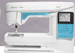
HUSQVARNA VIKING® OPAL™ 690Q